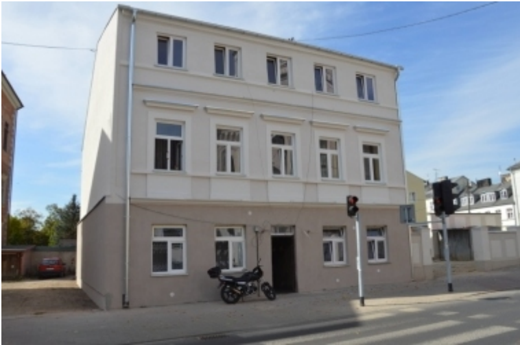
ul. Jerozolimska 30