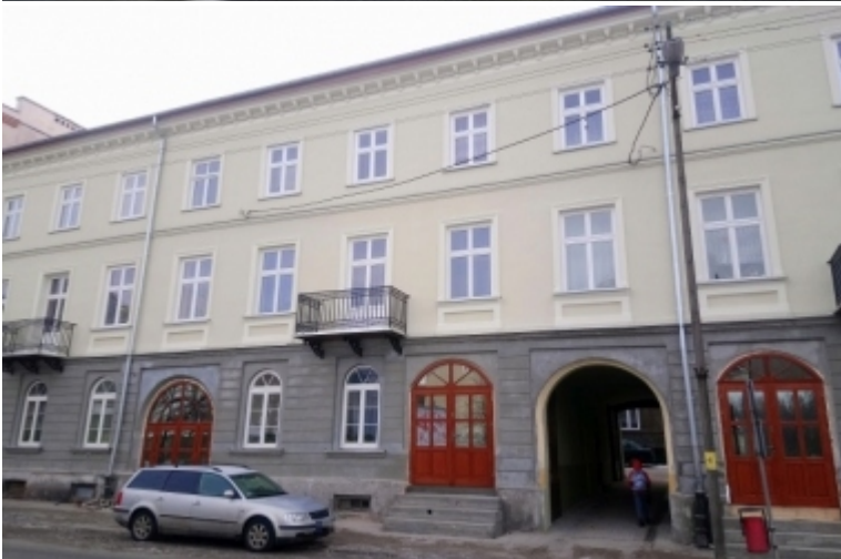
ul. Wojska Polskiego 48