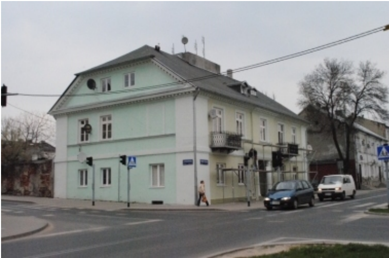
ul. Wojska Polskiego 5