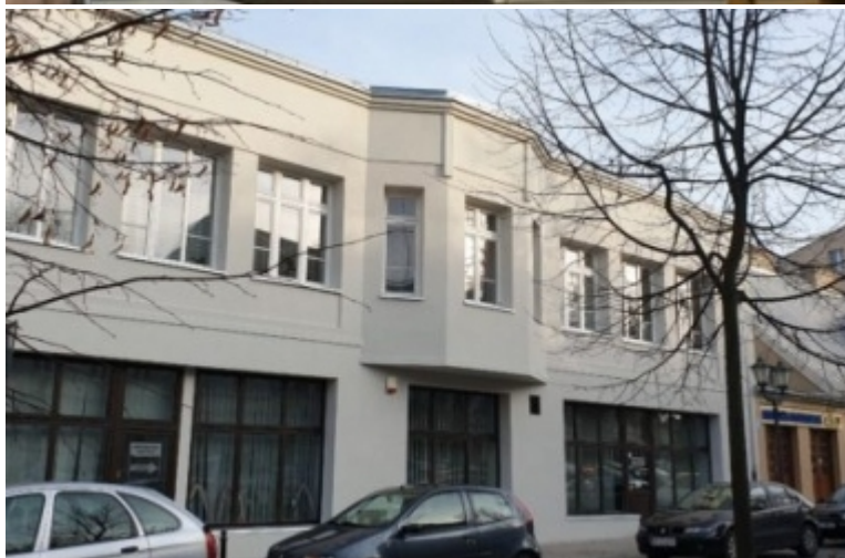
Plac Czarnieckiego 6/7