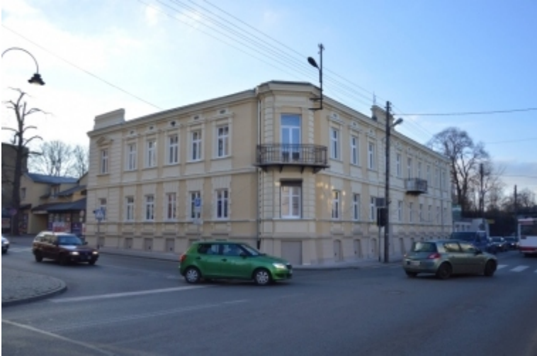
ul. Wojska Polskiego 64