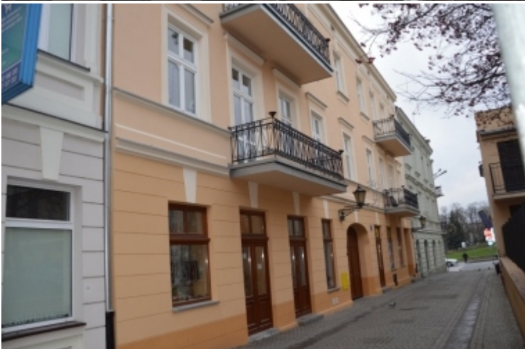
ul. Szewska 8