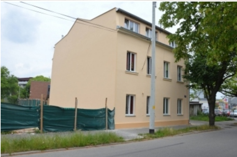
Pl. Litewski 6