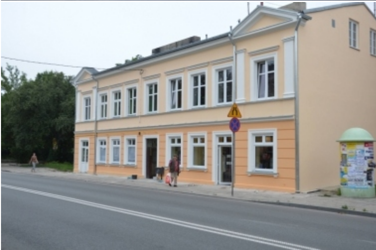
ul. Wojska Polskiego 79