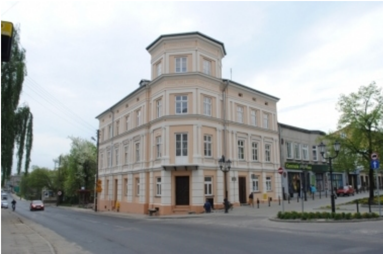
ul. Wojska Polskiego 20