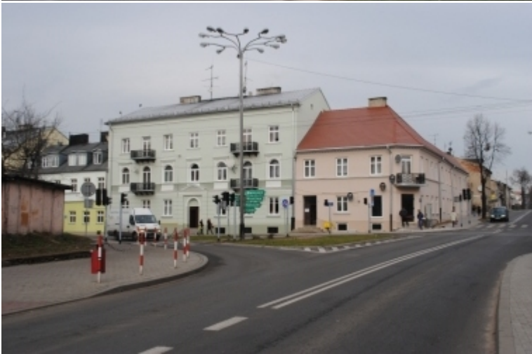
ul. Wojska Polskiego 7 i 9