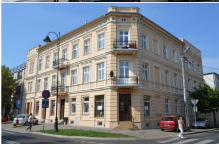
Al. 3 Maja 23