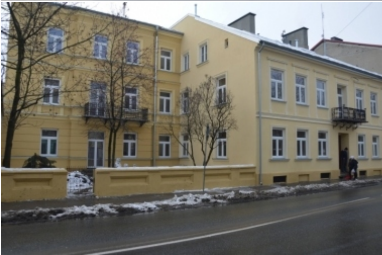
ul. Wojska Polskiego 32