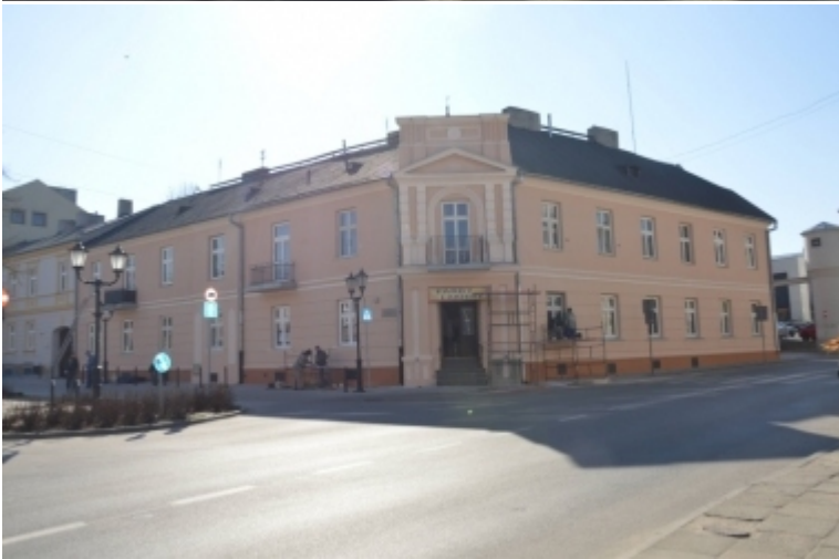
Pl. Czarnieckiego 3