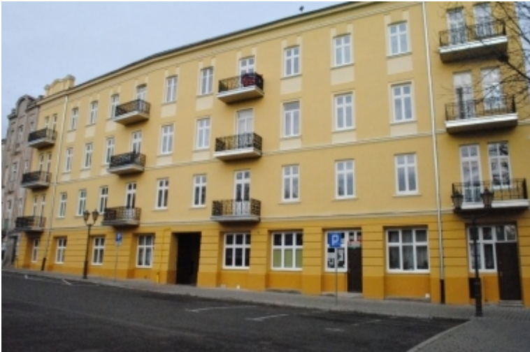
Pl. Niepodległości 4