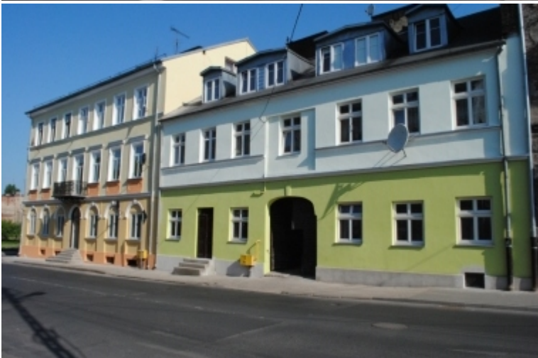
ul. Wojska Polskiego 11 i 13