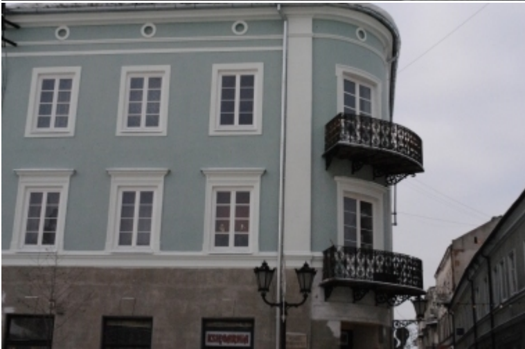
Rynek Trybunalski 2